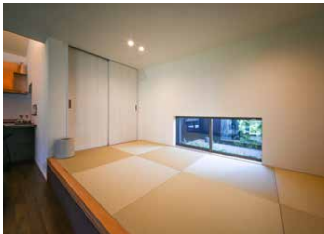
上／LDKは、天井の高低差でメリハリのある空間に。キッチンの隣はパントリー。 左／リビングの畳コーナー。小上がりに腰かけると正面にガレージが見える。 下・左／畳コーナーの小窓から見える、もうひとつの中庭。洗濯物は窓から見えない場所に干しているので、来客時でも安心。 下・右／洗面・脱衣スペース。キッチンと隣接しており、洗濯もすぐ干せる動線。