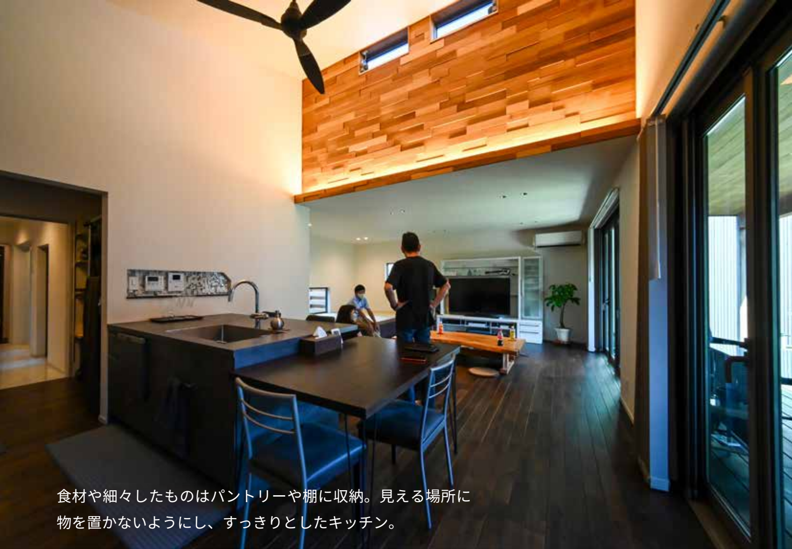
食材や細々したものはパントリーや棚に収納。見える場所に物を置かないようにし、すっきりとしたキッチン。